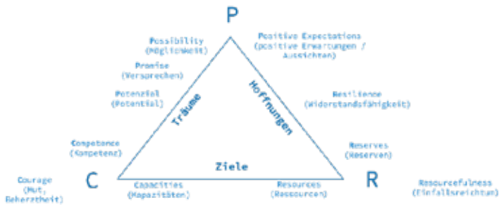
Abbildung 3: Stärkenmodell nach Saleebey, zitiert in Ehlers / Müller / Schuster 2017:43, eigene Darstellung

Wir verstehen Stärken als persönliche Kraftquellen von Individuen – wie Träume, Hoffnungen, Ziele, Überzeugungen – sowie als deren spezifische Fähigkeiten und Kompetenzen. 58