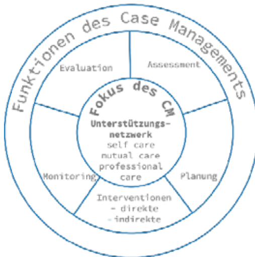
Abbildung 2: Der Regelkreislauf oder „A Multi-Functional Framework of Case Management Practice“, Moxley 1989:18, adaptiert

Wir beziehen uns bei der Darstellung des Case-Management-Prozesses auf David Moxley, der den dreifachen Fokus ins Zentrum des Regelkreises stellt. Der Autor führt in diesem Zusammenhang aus, dass im Case Management die Selbstsorge der Klient*innen mit professionellen und informellen Hilfen verknüpft wird, um so ein an den Bedürfnissen, der Funktionsfähigkeit und den Zielen des*der Klient*in bzw. des Klient*innensystems ausgerichtetes Unterstützungsnetzwerk zu etablieren.